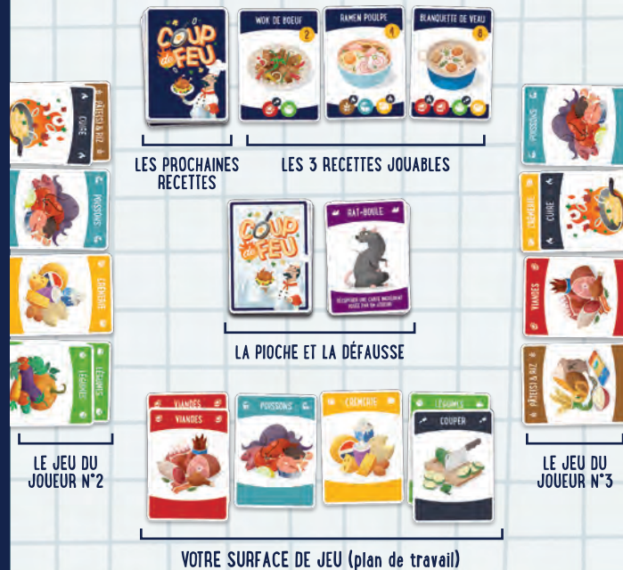
LE JEU DU JOUEUR N°2