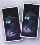
Cartes Monstre Noir