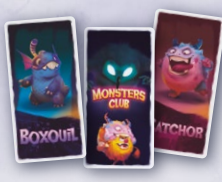
Cartes Famille de Monstres